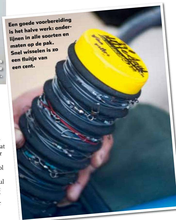
Een goede voorbereiding is het halve werk: onderlijnen in alle soorten en maten op de pak. Snel wisselen is zo een fluitje van een cent.

Dat de wintervisserij op het strand van Zoutelande populair is, blijkt wel uit het feit dat ruim drie uur voor laag water alle strandvakken op loopafstand van de parkeerplaats vol staan met zeevissers. Niet zo vreemd aangezien de vaargeul hier heel dicht onder de kant loopt, waardoor je op relatief korte afstand al in diep water vist. Met name overdag kan dat wel eens het verschil be-