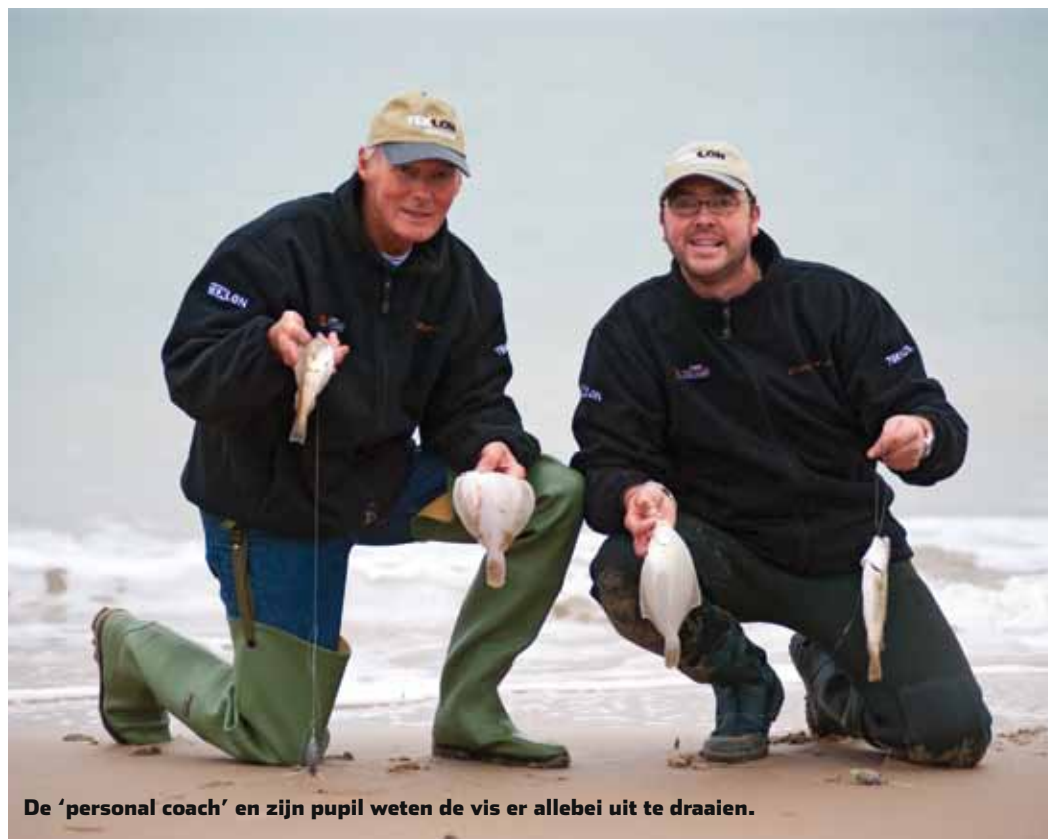
De 'personal coach' en zijn pupil weten de vis er allebei uit te draaien.

vis zit." Wil het even niet lukken, dan luidt het advies om het over verschillende afstanden te proberen. "Misschien ligt er op vijftig meter wel een prachtige mui waar de vis zich ophoudt. In de periode rond november en december zit er vaak echter zoveel vis, dat het niet uitmaakt of je op 70 of 100 meter vist. Het is wel zo dat de vis in de donkere uren dicht onder de kant komt, overdag moet je vaak iets verder kunnen gooien."