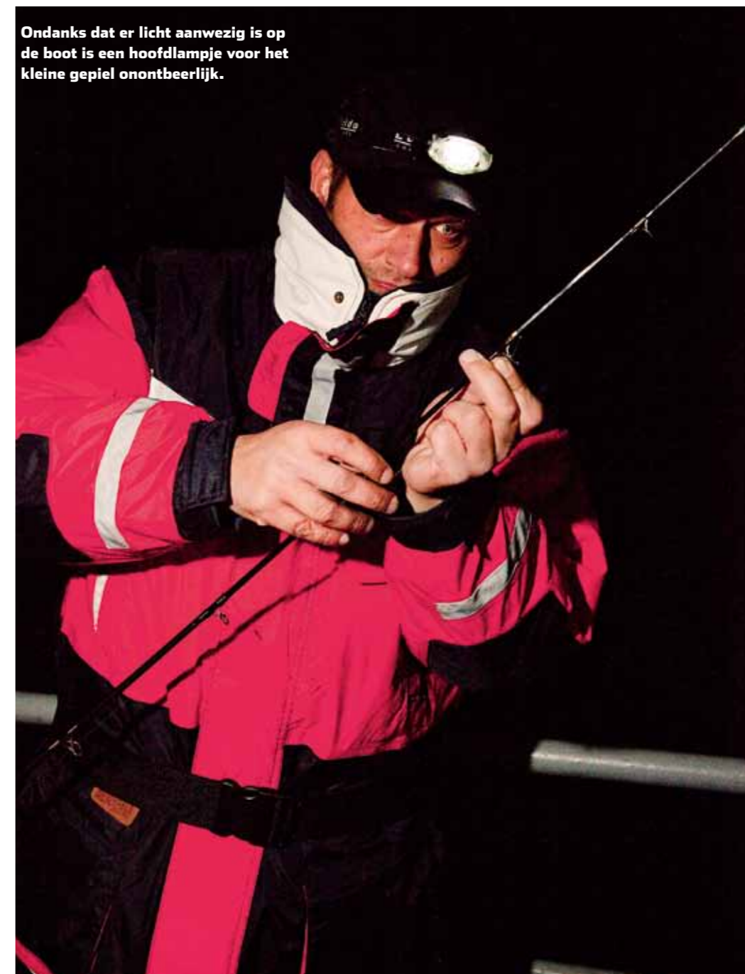
Ondanks dat er licht aanwezig is op de boot is een hoofdlampje voor het kleine gepiel onontbeerlijk.