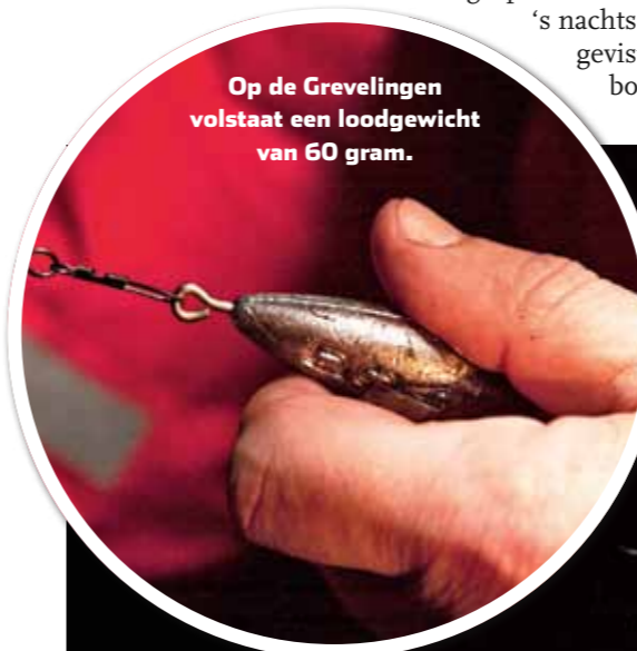
Op de Grevelingen volstaat een loodgewicht van 60 gram.

lagen opzoeken waar de vis zich bevindt – dit kan ook gemakkelijk door het ontbreken van stroming. Daarbij begin ik op de bodem, om daarna de molen telkens met één of twee slagen (afhankelijk van de inhaalsnelheid) omhoog te