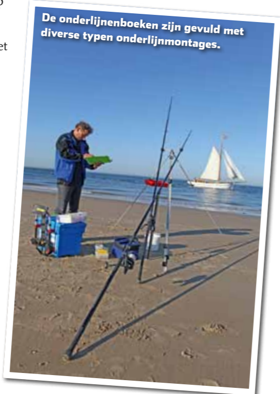
De onderlijnenboeken zijn gevuld met diverse typen onderlijnmontages.

nog niet het geval te zijn voor de zeebaars, schol en tong. Daarbij komt de bot eigenlijk het gehele jaar wel in onze kustwateren voor. Afhankelijk van de watertemperatuur zullen ook de wijting en schar rond oktober weer de kustwateren opzoeken. In dit artikel zal ik mijn manier van vissen per vissoort behandelen.