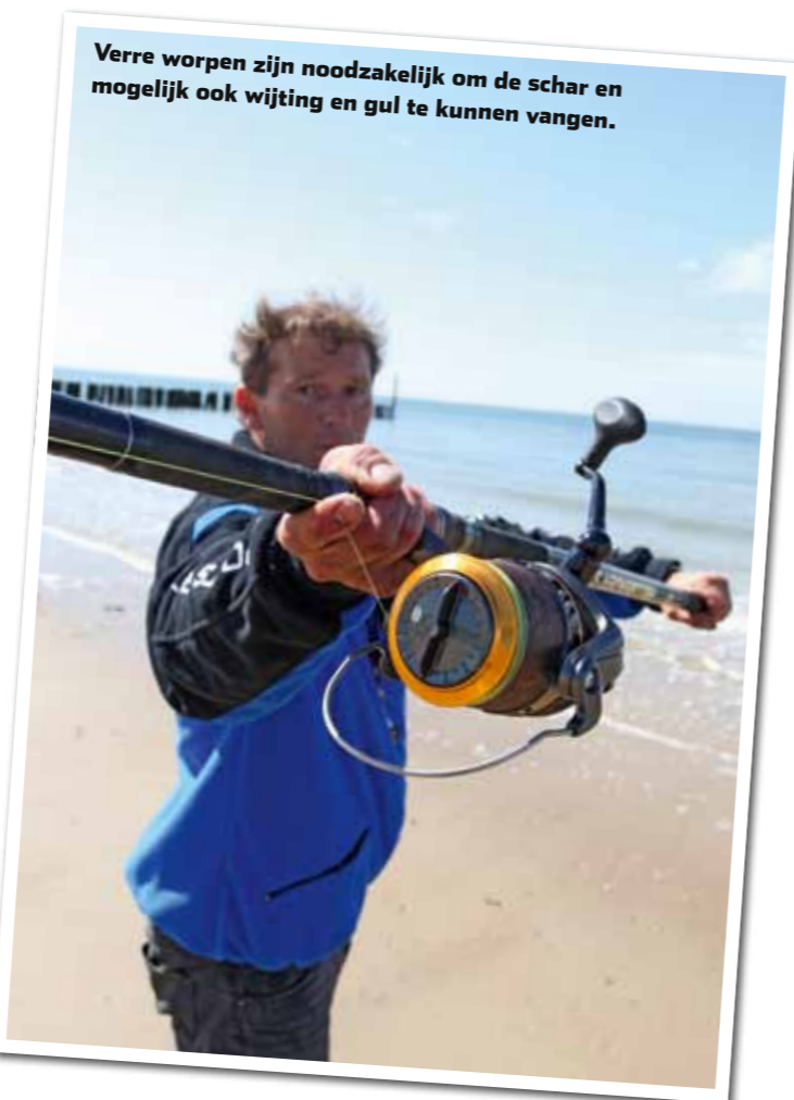
Verre worpen zijn noodzakelijk om de schar en mogelijk ook wijting en gul te kunnen vangen.

Het vissen met de genoemde technieken biedt enkele voordelen. Zo kan de vis de beaasde haak die wordt gevist aan dunne haaklijnen gemakkelijker in de bek nemen. Zeebaars is een echte rover die het aas pakt dat tijdens het zwemmen op zijn weg komt. Als dat niet goed in de bek is verdwenen, is je kans verkeken. De zeebaars zal echt niet omdraaien om het aas nog een keer te pakken. Een ander voordeel is dat bij achter het lood geviste haaklijnen de gehele onderlijn keurig op de stroming komt te liggen. Met name bij een harde stroming of veel golfslag kan een traditionele onderlijn – die rechtstreeks aan de hoofdlijn is verbonden – als nadeel hebben dat het aas niet op de juiste wijze wordt aangeboden. Dit omdat je de onderlijn uiteraard haaks op het strand inwerpt, terwijl de stroming evenwijdig aan de kustlijn loopt. De kans bestaat dat de hoofdlijn zoveel stroomdruk krijgt dat de onderlijn als het ware iets van de grond wordt getild of door ruwe golfslag onnatuurlijk in beweging