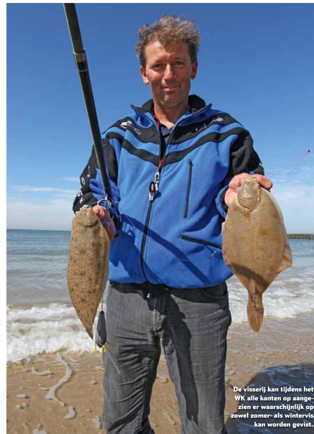
De visserij kan tijdens het WK alle kanten op aangezien er waarschijnlijk op zowel zomer- als wintervis kan worden gevist.

Bij het vissen op platvis is het een kwestie van keuzes maken door middel van de afstand waarop je de montage weg zet. De ene platvis houdt zich namelijk wat verder van het strand op dan de andere. Zo hoef je bij het vissen op bot vaak helemaal niet ver te werpen. Zeker wanneer er wat wind op de kant staat en het water met het getij opkomt, kun je botten tot op enkele meters uit de kant vangen. De andere platvissen, met name