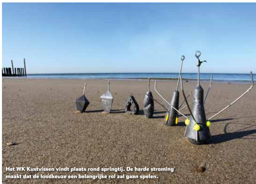
Het WK Kustvissen vindt plaats rond springtij. De harde stroming maakt dat de loodkeuze een belangrijke rol zal gaan spelen.

de worp vele malen rond de onderlijn draaien en zo hun vangkracht verliezen. Bij een stevige wind recht van voren en een ruwe zee, kies ik voor dikkere haaklijnen van plusminus 30/00. Bij rustig weer is dat zo'n 22/00.