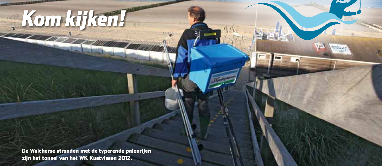
De Walcherse stranden met de typerende palenrijen zijn het toneel van het WK Kustvissen 2012.

WORLD CHAMPIONSHIPS SHORE ANGLING 2012 MEN & WOMEN 13 - 20 OCTOBER VEERE THE NETHERLANDS