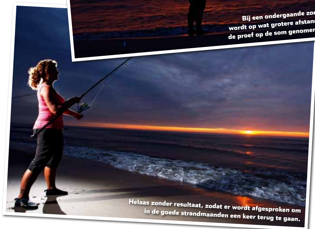
Helaas zonder resultaat, zodat er wordt afgesproken om in de goede strandmaanden een keer terug te gaan.