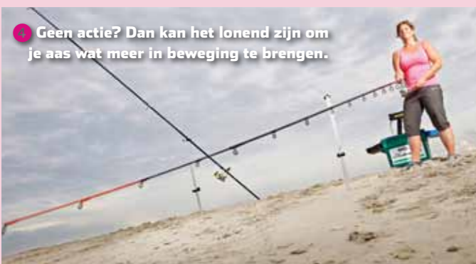
3 Geen actie? Dan kan het lonend zijn om je aas wat meer in beweging te brengen.