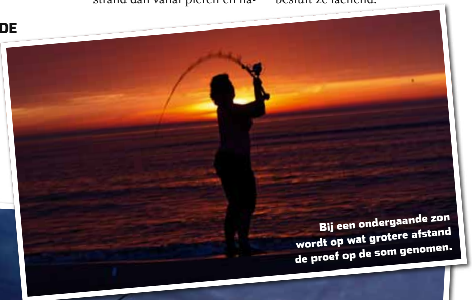
Bij een ondergaande zon wordt op wat grotere afstand de proef op de som genomen.

Als wij onze knappe, vissende brunette vragen wat haar favoriete zeevisstekken zijn, dan aarzelt ze geen moment en