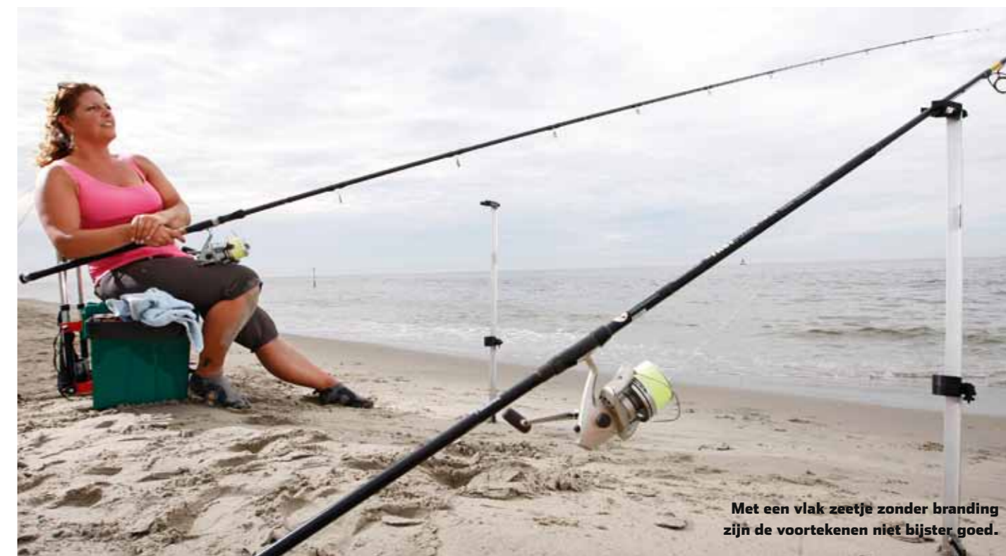
Met een vlak zetje zonder branding zijn de voortekenen niet bijster goed.