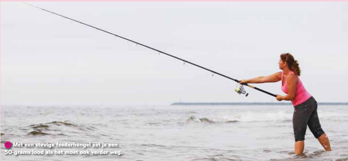
1 Met een stevige feederhengel zet je een 50-grams lood als het moet ook verder weg.

Saskia's strandvisserij bestaat vooral uit het zogeheten 'peuteren'. Dit komt neer op subtiel pielen met licht materiaal op relatief korte afstand, bijvoorbeeld in of nét achter de branding.