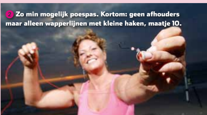
2 Zo min mogelijk poespas. Kortom: geen afhouders maar alleen wapperlijnen met kleine haken, maatje 10.