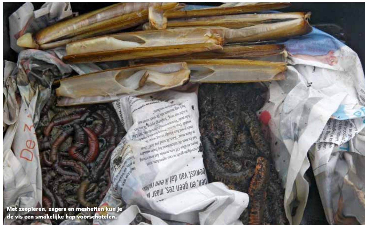
Met zeepieten, zaggers en mesheften kun je de vis een smakelijke hap voorschotelen.

het afzinkende lood pas ter hoogte van zijn driepoot de bodem. “Tijdens de worp is het nuttig de hengel richting het lood te laten wijzen. Dit levert minder weerstand op, waardoor je net wat verder gooit.” Niet onbelangrijk als je soms afstanden van meer dan 100 meter moet halen om de diepe vaargeul te bereiken. “Ook wacht ik met het sluiten van de molenbeugel tot het lood de bodem heeft bereikt. Dit omdat het nog een flink stuk met de stroom wordt meegesleurd. Daarna breng ik de lijn enigszins op spanning en leg ik de hengel in de steunen.”