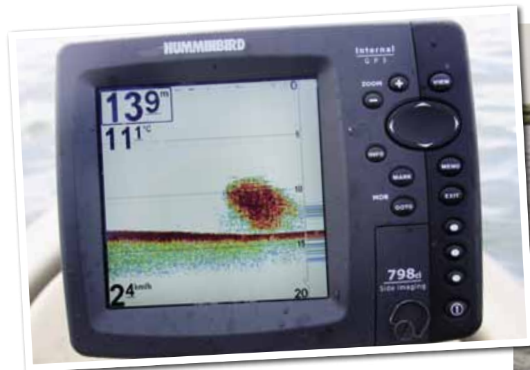
Zie je dit signaal op de dieptemeter, dan zit je boven een school haring en kan het feest beginnen!

telt zes haken. Die halveren we tijdens het varen dus nog snel even.