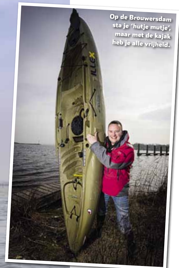
Op de Brouwersdam sta je 'hutje mutje', maar met de kajak heb je alle vrijheid.

maart.” Het spant er vandaag dus om. Voor de zekerheid is de verslaggever voor vertrek voor slikzagertjes langsgereken bij Hoek Ze hengelsport in het nabijgelegen Ouddorp.