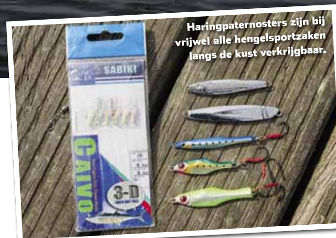
Haringpaternosters zijn bij vrijwel alle hengelsportzaken langs de kust verkrijgbaar.