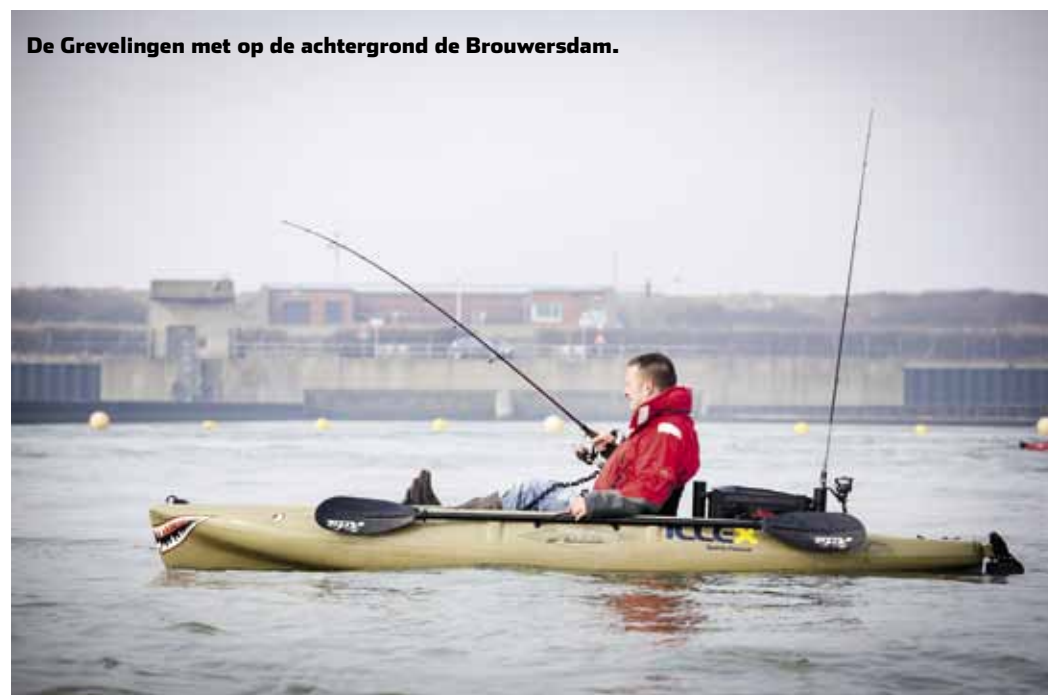
De Grevelingen met op de achtergrond de Brouwersdam.

Half maart – enkele dagen na deze reportage – kwamen via diverse internetkanalen toch de eerste vangstmeldingen binnen.