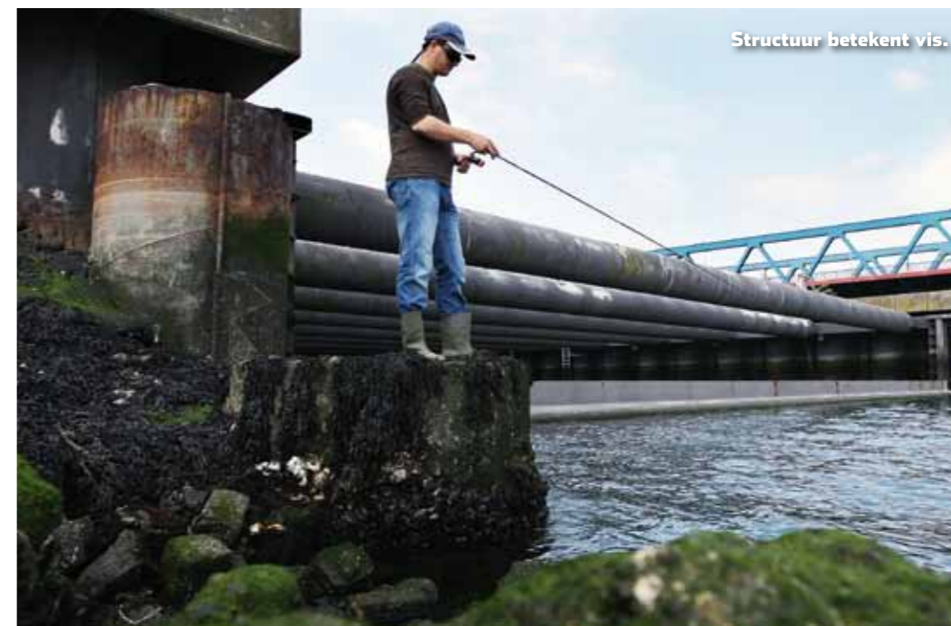
Structuur betekent vis.

bruggen en steenstort. "Structuur betekent doorgaans dat er zich veel voedsel ophoudt, dus daar vind je vanzelf ook de vis. Zoek je een geschikte LRF-stek, dan is het een kwestie van onderbrekingen in de kustlijn opsporen." Op die stekken kun je de vis zowel diep als zeer ondiep verwachten. De mogelijkheden qua vistechiek zijn dan ook groot. Marcel: "Dropshotten langs kades, jiggend kleine shadjes over de bodem laten huppelen en spinnend je kunsttaas binnendraaien zijn de bekendste technieken binnen de LRF-visserij."