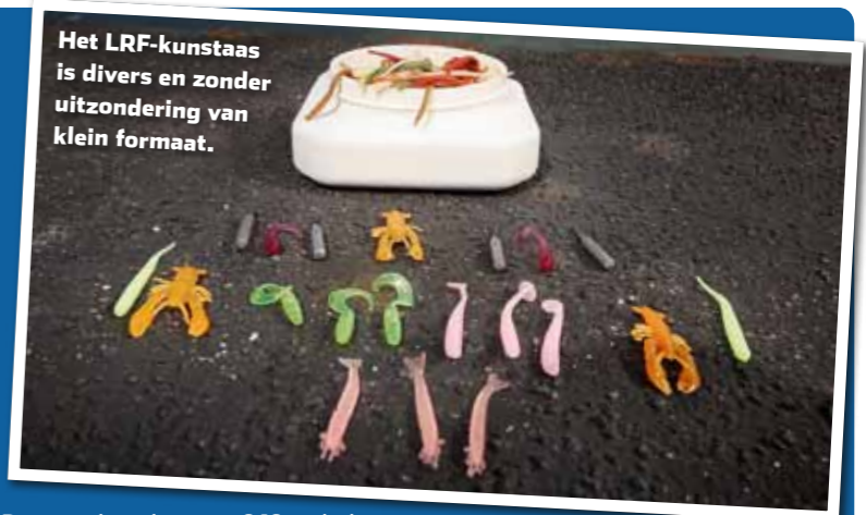
Het LRF-kunstaas is divers en zonder uitzondering van klein formaat.

Voor het light rock fishing kun je aan de slag met dezelfde materialen die voor het streetfishing worden gebruikt. Licht bakpat op pad is dus ook hier het codewoord. Marcel vist met een lichte dropshothengel van 2.10 tot 2.40 meter lengte die een gevoelige top heeft en tot zo’n 6 gram werpgewicht aan kan. Daarop komt een molen in het 1000 formaat met een goede slip. Deze spoel je vol met een 0.10 gevlochten lijn, zodat de aanbeten goed doorkomen. Als onderlijn kiest Marcel voor 17/00 fluorocarbon of zelfs nog iets dunner. Voor wat betreft het kunstaas zijn kleine shadjes, twisters, garnaal- en kreeft imitaties en Marukyu Isome wormen favoriet bij het dropshotten. De Isome zijn gemaakt van biologisch afbreekbaar materiaal (in de vorm van zaggers en wormen) en voorzien van een geurstof die de vis zeker wel kan waarderen. Verder zijn kleine plugjes, spinnertjes, pilkertjes en lepeltjes – denk eerder te klein dan te groot – geschikt om werpend mee te vissen. Tenslotte is een ondiep, rubber net handig om vis te kunnen scheppen op onhandige plekken zoals kademuurtjes en steenstort. Voor meer info over light rock fishing kijk je op de speciale Facebookpagina die Marcel beheert: zoek op Light Rock Fishing - LRF NL.