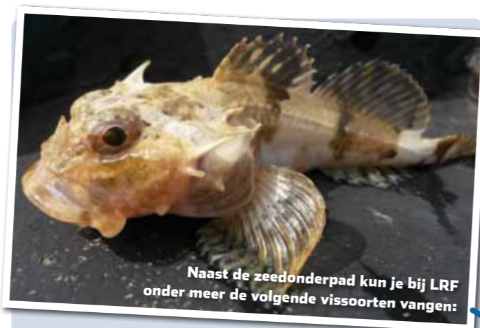
Naast de zeedonderpad kun je bij LRF onder meer de volgende vissoorten vangen:

Het feit dat het nog ietwat vroeg in het voorjaar is ten tijde van deze reportage, kan volgens Marcel ook meespe-