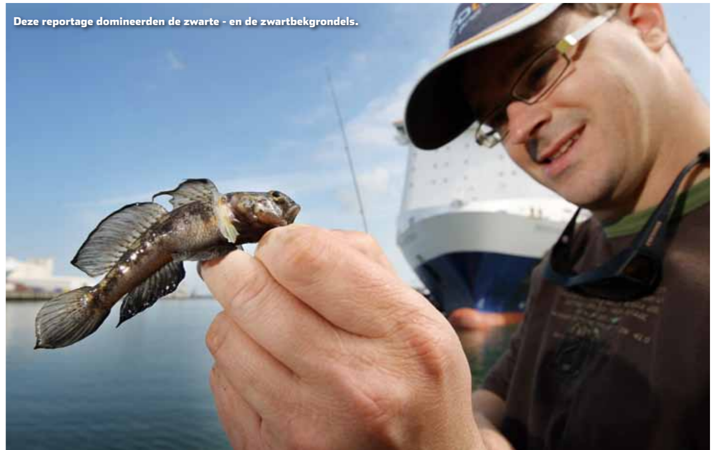
Deze reportage domineerden de zwarte - en de zwartbekgrondels.