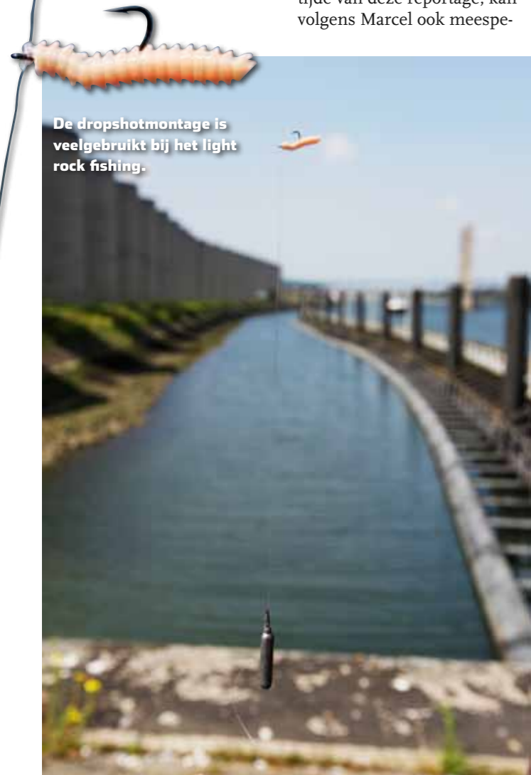
De dropshotmontage is veelgebruikt bij het light rock fishing.

havengebied, maar bijvoorbeeld ook in de Oosterschelde of op vakantie in het buitenland. Daar kun je zeekarper, -brasem of lipvis vangen. Dat is voor LRF-begrippen toch wel het ultieme!”