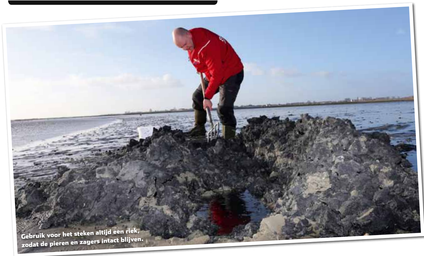
Gebruik voor het steken altijd een riek, zodat de pieren en zagers intact blijven.