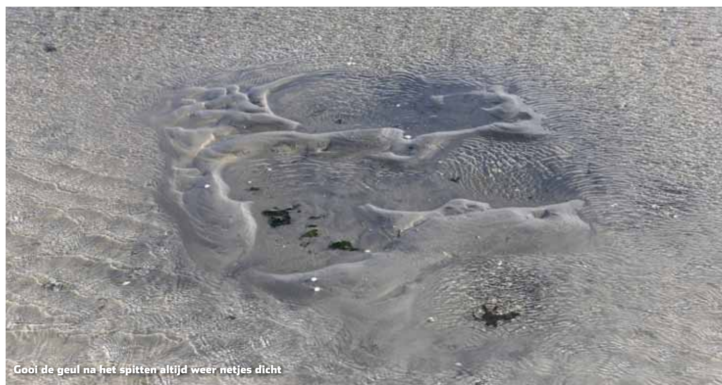
Gooi de geul na het spitten altijd weer netjes dicht

witjes gelukkig wel. "Witjes (of zandzagers) zijn te herkennen aan hun witte, parelmoerachtige kleur. Ook zijn deze zagerachtigen doorgaans kleiner en dunner dan zeepieren en zagers. Het zijn tere beestjes die niet lang houdbaar zijn – in hengelsportwinkels zijn ze vrijwel niet verkrijgbaar – maar het is een prima aassoort