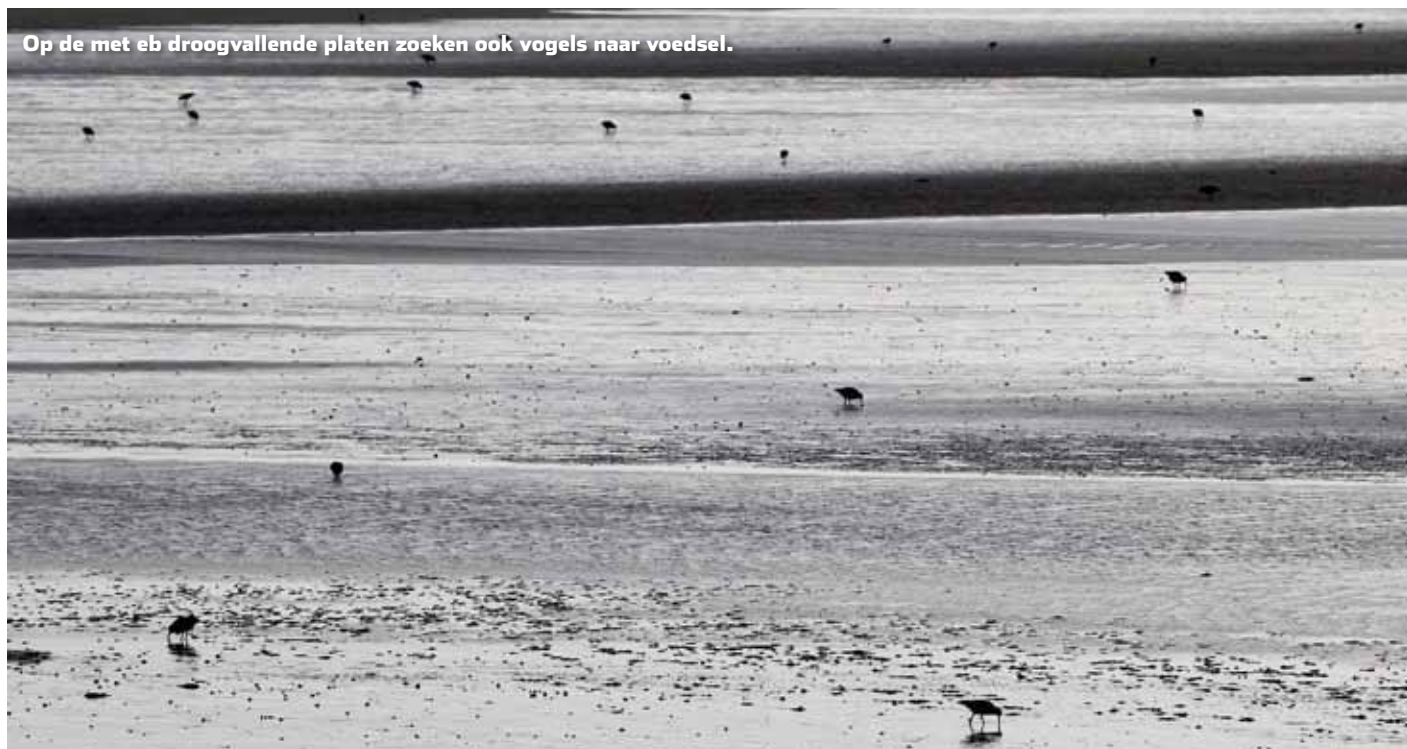
Op de met eb droogvallende platen zoeken ook vogels naar voedsel.

ik de riek dan ook vaak links liggen. Het is dan gewoon niet rendabel om te gaan spitten. Maar met de milde winters van tegenwoordig kun je vaak toch wel terecht. Tegen de zeevisser die qua aas niets aan het toeval wil overlaten zeg ik dan ook: ga toch spitten!"