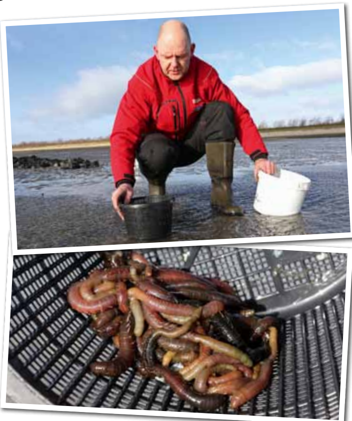
Spoel het vers gestoken aas schoon in een pot die bedoeld is voor water- en vijverplanten.

je met enkele uurtjes werk zo voor een paar tientjes aan aas. We steken vaak aan het begin van de week, zodat de pieren goed hebben kunnen drogen voordat we er aan het einde van de week mee gaan vissen."