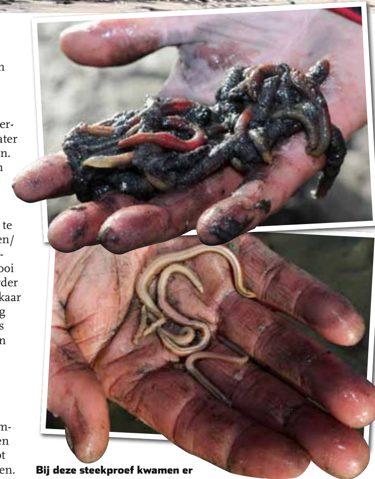
Bij deze steekproef kwamen er zeepiers en witjes tevoorschijn.

Als snel komen de eerste pieren en witjes uit het zompige slik tevoorschijn. “Even zeven en spoelen en je hebt kakelvers zee-aas voorhanden. Daarvoor gebruik ik een pot