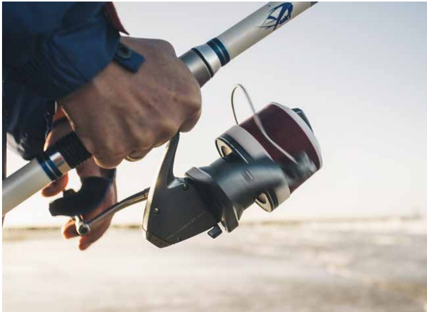
Bij de zoute 'wedstrijdtop' is een 16/00 hoofdlijn zeker geen bijzonderheid meer.